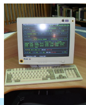
Interfața OPAC a BUDJG

Dacă nu ați găsit informații în catalogul electronic al BUDJG, folosind criteriile menționate, vă recomandăm să folosiți catalogul colectiv al bibliotecilor din